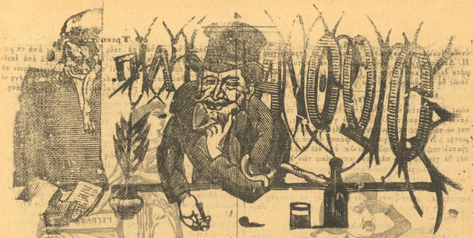
Ἡ ἀρχή μου εἶναι νὰ μὴν ἔχω κάμμειαν ἀρχήν.

ΦΟΡΟΙ ΑΠΑΡΑΒΑΤΟΙ. —Συνδερπή προπληρωτρία στὴν Ἑλλάδα 12 δρ. στὸ δέω τῆς Ἑλλάδος 15. Ἐκδίδεται τοῖς πρὸς ἑβδομάδας, ἀπὸ 7—8 χιλιάδες εὐρόλια. Ἡ ἀκμια καταχώρησι δὲν ἔχει πληρωμὴ, οὔτε γιὰ τὰς γωιστοποιήσεις. Ἡ ἡμέρη καταχώρησι εἶπε τυπωθῆ, εἶπε μὴ, δὲν ἐκπαιστρέσειται. Ὅσοι μὲν ἐσέλιον γράμματα πρέπει νὰ ἔχουν πάντοτε ὑπογραφή, καὶ ἡ ὑπογραφή τους θὰ τυπώνεται. Διάφενει νὰ μὴ δὲν γίνεταί, καὶ ὅσοι εἰδουν νὰ κάνουν τέτοιαις ἀς πᾶν σ' ἄλλαις ἐφημερίδαι. Γράφε ξεγράφε δὲν ἔχει. Ὅσοι γράφουν ποῦνα, γὰ ἔβρου πῶς τὰ γράμματα δὲν θὰ διαβάζωνται.