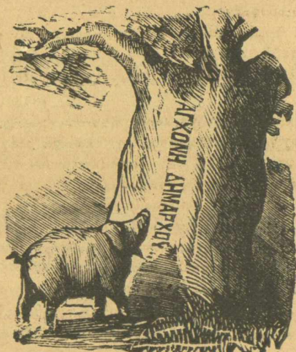
Τὸ δένδρο αὐτὸ τὸ θανατᾷει καὶ ἕνα χρυσογούρνο.

Τὴν νύχτα τῆς τετράτης καὶ στῆς 5 ὕστερα ἀπὸ τὸ μεσημέρι, ἀφοῦ τὸν σάπισαν στὸ ξύλο, πού ὡς καὶ ὁ κλητῆρας πού τὸν εἰσαγγέλει μὲ τὸν ψαρεβούρδουλα εἶχε κουραστῆ καὶ κόλλη-