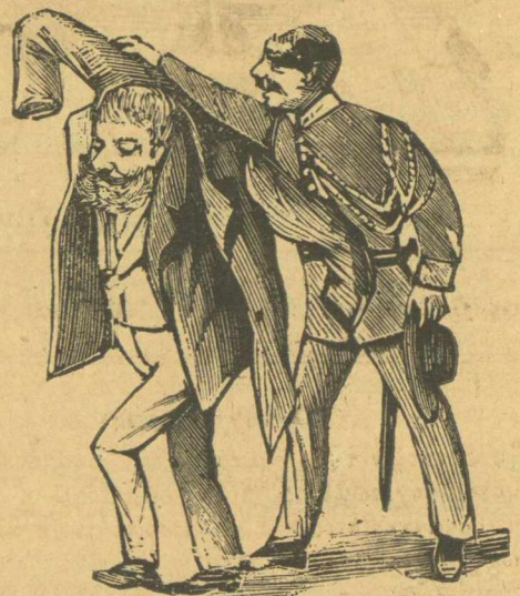
Σταυρωτῆς. — Δὲν ξέρω τίποτα, γρήγορα στὴν ἀνάκρισι, κύρ Δήμαρχε.

Καὶ ὅμως τὸ Σύνταγμα λέει.— Ἀπαγορεύονται τὰ βραυστήρια Τύφλες.