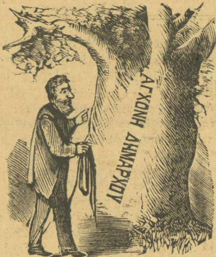
Ο Φιλήμων σκέπτεται πῶς νὰ κρεμάσῃ τὸ σκουρὶ.

πιδερα στὰ χέρια σταυρωτὰ, χωρὶς νερό, φαγεῖ ὅμως τοῦδιναν γιὰ νὰ δηψᾷ καὶ τὸν ἀνάγκαζαν νὰ φάῃ μὲ τὸ ζόρι, στὴν θέσι πού τὸν εἶχαν ὄρθιο χωρὶς νὰ ἀκομπᾷ στὸν τοῖχο τὸν κράτησαν χωρὶς νὰ τὸν ἀφήσουν νὰ κλείσῃ μάτι ὅσαις μέρες εἶπαμε, ἅμα δὲ ἔκανε πῶς ἐκλείναν τὰ μάτια του μοναχὰ τους καὶ χωρὶς νὰ θέλῃ τοῦ κατέβαιναν ἢ βουρδουλειαὶς καὶ τὰ χαστούκια σὰν βροχὴ ἀπὸ κείνους πού τὸν φύλαγαν.