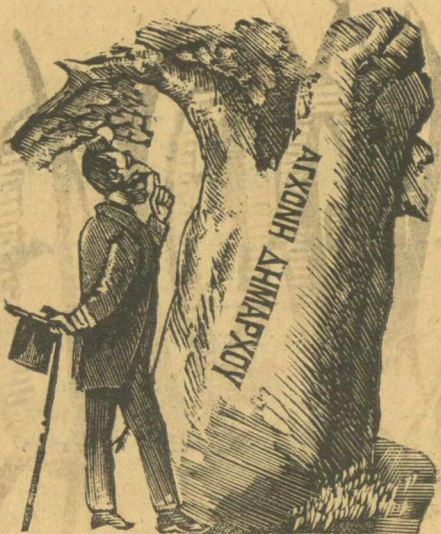
Ο Νομάρχης επιθεωρᾷ τὸ δένδρο πού θά κρεμάσῃ τὸν Δήμαρχο.

πιδερα στὰ χέρια σταυρωτὰ, χωρὶς νερό, φαγεῖ ὅμως τοῦδιναν γιὰ νὰ δηψᾷ καὶ τὸν ἀνάγκαζαν νὰ φάῃ μὲ τὸ ζόρι, στὴν θέσι πού τὸν εἶχαν ὄρθιο χωρὶς νὰ ἀκομπᾷ στὸν τοῖχο τὸν κράτησαν χωρὶς νὰ τὸν ἀφήσουν νὰ κλείσῃ μάτι ὅσαις μέρες εἶπαμε, ἅμα δὲ ἔκανε πῶς ἐκλείναν τὰ μάτια του μοναχὰ τους καὶ χωρὶς νὰ θέλῃ τοῦ κατέβαιναν ἢ βουρδουλειαὶς καὶ τὰ χαστούκια σὰν βροχὴ ἀπὸ κείνους πού τὸν φύλαγαν.