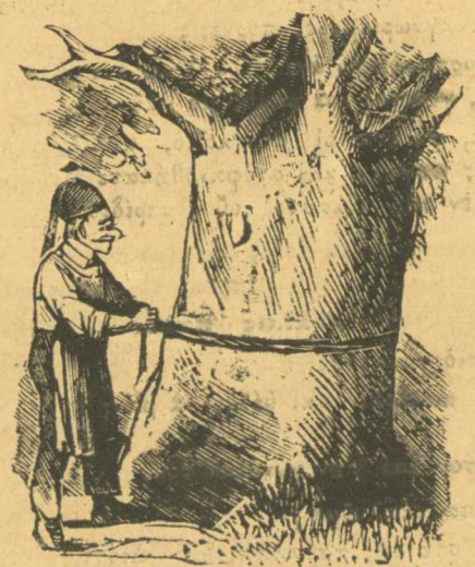
Πολίτης. Ἀφοῦ λοιπὸν ἐδῶ δὲν θὰ κρεμάσουν κανένα, ἄς κρεμάσω τὸ ἴδιο δέντρο.