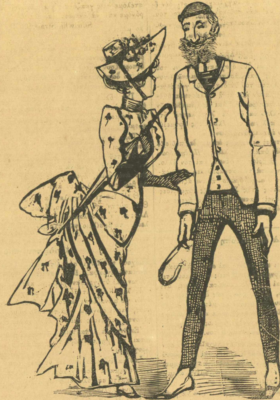
Δημαρχία. — Ἀγαπημένε μου Δήμαρχε, μὴ φοβᾶσαι καὶ ὁ Νομάρχης δὲν θὰ μᾶς χωρίσῃ. Δῆμαρχος. — Ἀλήθεια, ψυχούλα μου ; Ἀχ, γιὰ σένα θυμῆσου πόσα ξόδεψα.

Ἐπίσης ἔλαβα ἀπὸ ἓνα εὐγενῆ συνδρομητῆ μου ἀπὸ τῆ