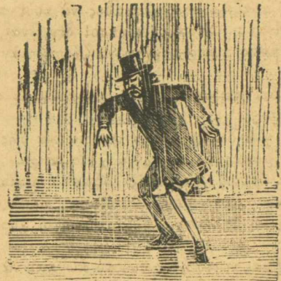
Ὅλοιτε κατάστασις πραγμάτων μ' αἰτιαί τῆς βροχαίς.

Δὲν συμμαζεύεσε κακομοίριδες, τὰ σῆλιχ σας, νὰ μὴ γελά μὲ σᾶς, ὁ κόσμος.