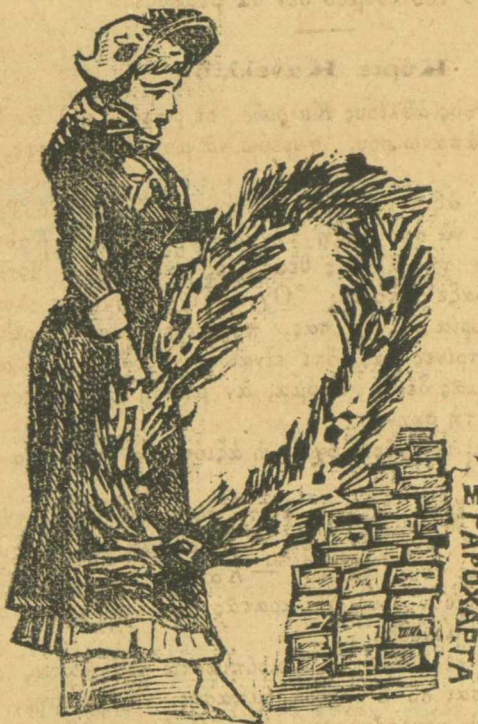
Νεκρικός στέφανος γιὰ τὰ τσιγαροχάρτα.