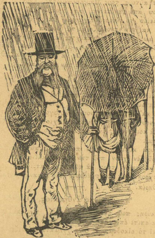
Και μ' αὐταῖς τῆς βροχῆς ὁ Δεληγιάννης μας τρίχει ἔως πὸν βλέπετε νὰ μαζέψῃ βουλιχτάς.

γλυκὸ ποὺ ἦταν τὸ φιλι γι' αὐταῖς τρελένεται πολὺ γι' αὐτὸ καὶ δὲν νυμφεύεται καὶ δὲν φοβᾶται ἰὰ τῆς πῆ, φιλι νὰ τοῦ δανείσω καὶ νὰ τῆς τὸ δῶση πίζω.