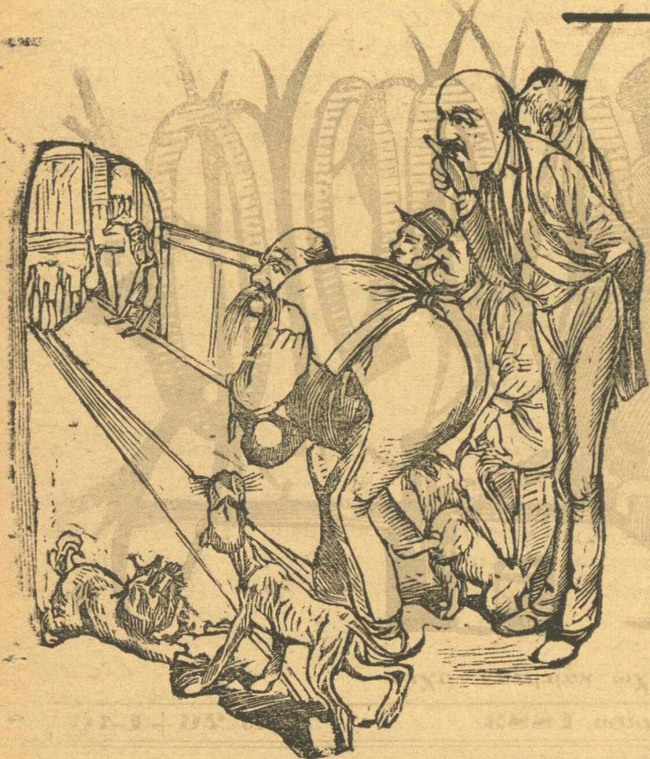
Τοῦ προέδρου τῆς ἀρτιπολίτεψις τοῦ ρίχτηκαρ καὶ τὰ σκυλιὰ τῆς ἀρτιπολίτεψις.

περὶ μὲ μένα, θὰ τὸ ταίζω ζάχαρι καὶ θὰ τὸ ποτιζῶ μέλι. Ἡ δὲ μάνα τὸν ἔλεγε : — Δὲν σὸ δίνω, εἶναι μικρὸ ἀκόμα. Καὶ ὁ μπαλωματῆς πάλι τῆς ἀπαντοῦσε. — Δὲν μοῦ τὸ δίνεις, μὰ θὰ σοῦ τὰ κλέψω, γιατί τὸ κορίτσι τὸ θέλω γὼ νὰ τὸ βάνω σ' ἕνα σπίτι ποῦ νὰ κερδίζη τοῦ κόσμου τὸν παρᾶ.