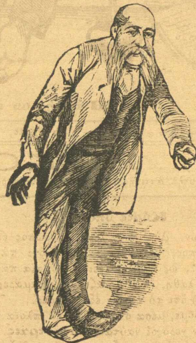
Ὁ μέλλων πρόεδρος προσεύχεται.

στὴ Νεάπολι κεῖ κοντὰ στὸ σπίτι τὸ μεγάλο ποῦ κτιζεὶ ὁ Γρηγοριάδης βρῖκε ἕνας καλὸς χριστιανὸς ἕνα μπογαδάκι μὲ β ζευγάρια κάρτσαις, ὅποια λοιπὸς φτωχὰ ἢ πλούσια τάχασε ἄς πᾶη νὰ ρωτήση στὸ φαρμακεῖο τοῦ Τσακαλιώτου, νὰ τῆς δεῖξουν ποῖος τὰ βρῖκε καὶ τὰ παραλάβῃ.