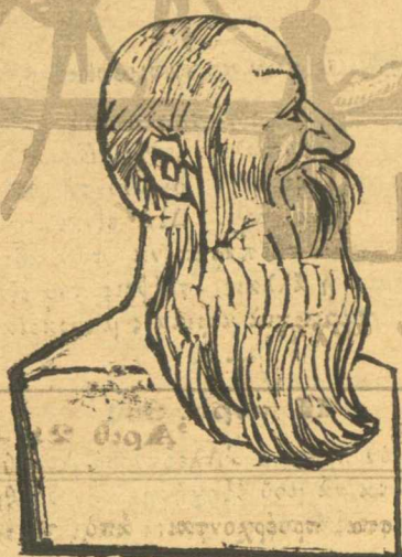
Ὁ Ρόκος μας.

Δέν πρέπει, φίλτατε Κορομυαλά, νὰ ἐνοχλᾶς ἀνθρώπους γιὰ παλαιὰς ἀμαρτίαις καὶ οἱ ὅποιοι τὸρα ζοῦν στὴν κοινω- νία τίμια ὅπως καὶ σὺ, δέν πρέπει νὰ ζήνης παλαιὰς πλη- γαῖς γιὰ νὰ μὴ βρῆς τὸν μπελά σου κάμμιά ὥρα μὲ τὰ δυὸ σου χέρια. Σὺ τὸρα καταλαβένεις πλιὸ τί ἐννοοῦν αὐτὰ τὰ λόγια.