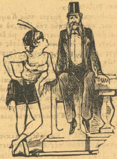
Ἡ ξειταιπομένη βουλή κοροϊδεῖ τὸν Δεληγιάννη.

Οἱ Ἕλληνες τῆς Μικρᾶς Ἀσίας σ' ὅλαις τῆς δειναῖς περι- στασίσεσι τῆς πατρίδος προσέφεραν χιλιάδες λίρες μὲ κίνδυνο βέ- θαιο, καὶ στὴν ἐπιστρατεία ἦρθαν κατὰ ἑκατοντάδες νὰ χύ- σουν τὸ αἷμα τους καὶ τὸρα ὅταν βλέπουν τὴν ἐθνικὴ σημαία σ' ἓνα πολεμικὸ μας πλοῖο, τρέχουν καὶ φιλοῦν τὸ κατὰστρωμα- του μὲ δάκρυα.