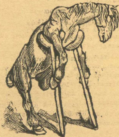
Τό πρώτο άλογο πού θά τικήση στο ίπποδρόμο.

Στόν λόγο πού άπάγγειλαν στην αύτου βασιλειότητα, είπε