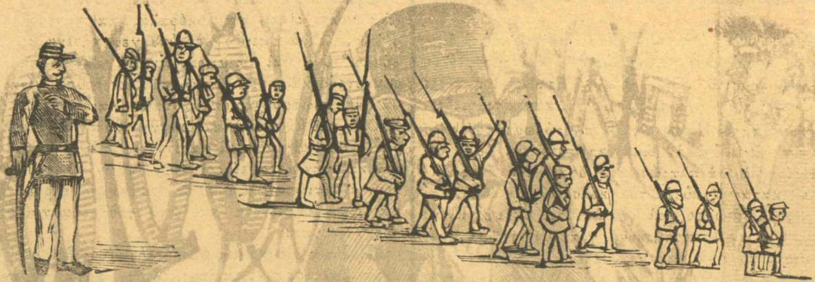
Ο τίσις εθνικός στρατός του Τρικούπη, πού θά πάρη την Πόλι.