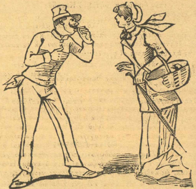
Ψυχή μου κουζίνα, μάτς.

Τα κατάλαβες, φιλαράκο μου Φιλήμων; Τα κατάλαβες να λές.