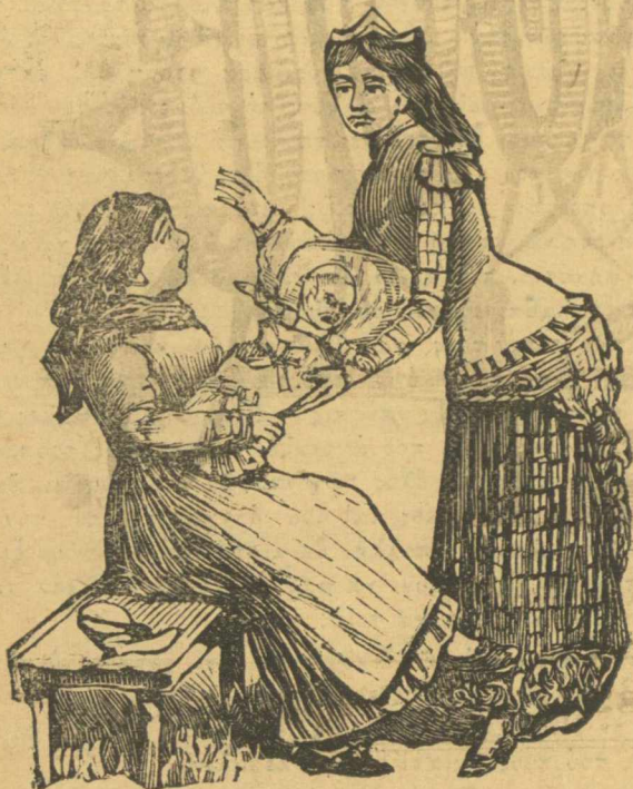
Βουλή. Βασιλεία, σου παραδίω το νεογέννητον κόμμα του Δεληγιάννη

Αυτή πλέον ή μπουνταλίσουνα και άφροντησία του δήμο για την άθλια κατάσταση των γκαζών, υπερβαίνει κάθε όριο, και δεν μένει άλλο παρά να βγούμε κάμια βραδιά να σπάσωμε όλα τα φανάρια να πάη στο διάολο τέτοια κλεφτε- ταιρία του Γκαζιού, "Αμ άλλο δεν μένει.