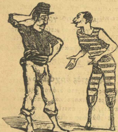
Κληροῦχοι ἀτίκατοι καὶ ἱκανοὶ γιὰ κάθε ὑπηρεσία