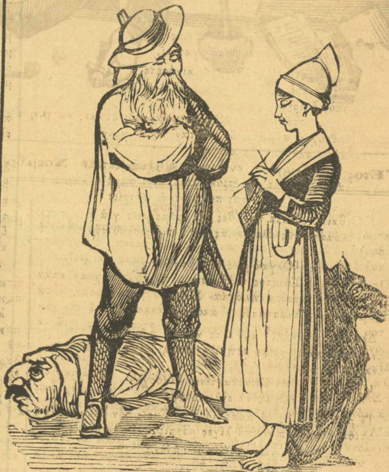
Μάλιστα, κυρὰ ξυπολιάρη βουλή, εἶμαι δημοκρατικὸς βέρος.

Τώρα ὁ Καραβέλης θέλει νὰ τὸν περάσῃ στὸν Παληάνθρωπο αἰ καλὰ νὰ ποῦ τὸν πέρασε, δὲν μᾶς λέει τόρα μ' αὐτὸ τὸ πέρασμα πῆρε τὰ λεπτά του πίσω; Ἐγὼ θαρρῶ πῶς ὁ Πετρόπουλος θὰ ἦναι πολὺ εὐχαριστημένος νὰ τοῦ φάῃ ἄλλαις 500 δραχμαῖς καὶ ἄς τὸν περάσῃ χιλιαῖς φοραῖς ὁ Παληάνθρωπος.