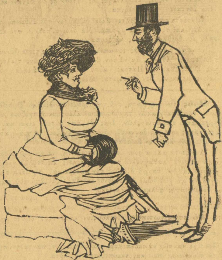
Διευθυντής. Κυρία γαλλίς, να βγῆτε έξω από τὸ θέατρο, διότι είστε χοιτήρῃ και πιάνετε πολλή τόπο.

Ναι μὲν λέγουν οι γραφαις, ο δουλεύων εν τῷ ναῶ, εκ του ναού και τραφήσεται, αλλά δέν λέγουν ότι και κλεφτήσεται ο ναός ίνα όπως ο κλέφτης ζήσεται. Και θα σ' εἶ τὰ άποδείξω όλα τὰ πάντα αυτά περι δια γραμμάτων.