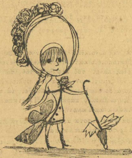
Η κομπάρσα του θεάτρου του Άρτρου των Νυμφών

Έλεγα να μη γράψωμε τίποτα για τὸ ιερό αυτό καθίδρυμα για να μη μάθουν της πομπαις και οι όξω έλληνες και οι επαρχιώτες και άποθαρρυνθοῦν και πάσουν να πηγαίνουν, αλλά τώρα σκέφτηκα, ότι όποιος ξέρει ένα κακό και τὸ σκε-