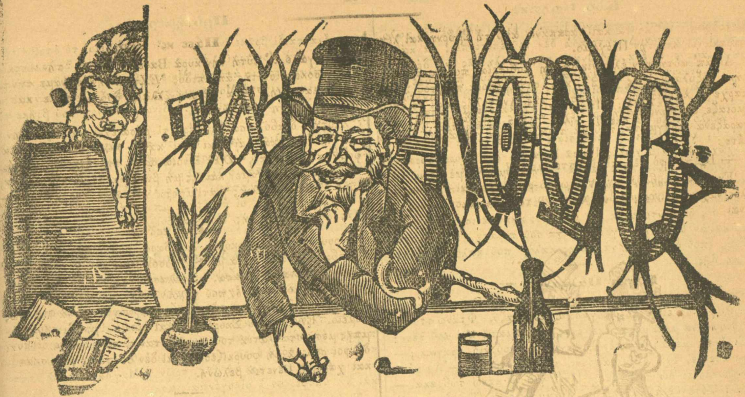
Ἡ ἀρχή μου εἶναι, νὰ μὴ ἔχω κάμμίαν ἀρχήν.