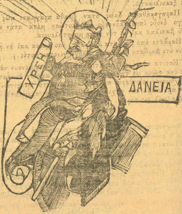
Ο Νέος Χρόνος έν στεφάνῳ δοξής.

«Πρός τόν κύριον Γ. Κ... εις Χαλκίδα άλλοτε άθυπασιπστην υπηρέτησαντα έν τῷ στρατῷ επί 15 έτη, νύν ιδιοτεύοντα, άλλοτε επιστάτην τῶν φυλακῶν, και επίλεκτον επί Όθωνος, λαβόντος μέρος και εις τά Ναυπλιακά ως επαναστάτης και άπολυθείς με βαθμόν άμευτον διαγωγής και νύν άπόμαχον και συνταξιοῦχον, εύποροῦντα δε και υγείως έχοντας.