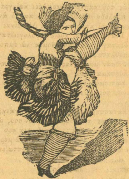
Ἐπίδειξις στὸ χορὸ τῆς Μαζούρκας.

Μὴ σοῦ κακοφνή, φίλτατε, ἀλλὰ ἐπειδὴ πολὺ κακῶς μὲ ἀνακατέψες σ' αὐτὴ τὴν ὑπόθεσι μὲ τὴν καλοσύνη μου, χωρὶς νὰ ξέρω περὶ τίνος πρόκειται καὶ ἐπειδὴ βρῖκα τὸν μπελᾶ μου κοντὰ σ' αὐτὴ τὴν δουλειά, ζητῶ νὰ ἱκανοποιήσης τὸν ἑαυτόν σου, γιὰτὶ δὲν θέλω σὺν φίλος μου ποῦ εἶσαι νὰ σὲ βρίζουν. Σὺ εἶσαι ἐξυπνος καὶ καταλαβαίνεις τί σοῦ λέω. Ἐπειτα ἀγαπητέ μου φίλε, ὅταν, φανῆς καλποζάνος σὺ, τὸν ὅποιον ἐτόλμησα νὰ συστήσω ὡς τίμιον μὲ τί μούτρα θὰ βγῶ αὔριον ἐγὼ νὰ ζητήσω μιανῆς πεντάρας συνδρομὴν ἀπὸ τοὺς συμπολίτας μας γιὰ ὅ,τι δῆποτε ὑπόθεσι; Σὲ ρωτῶ καὶ ἀπάντησέ με;