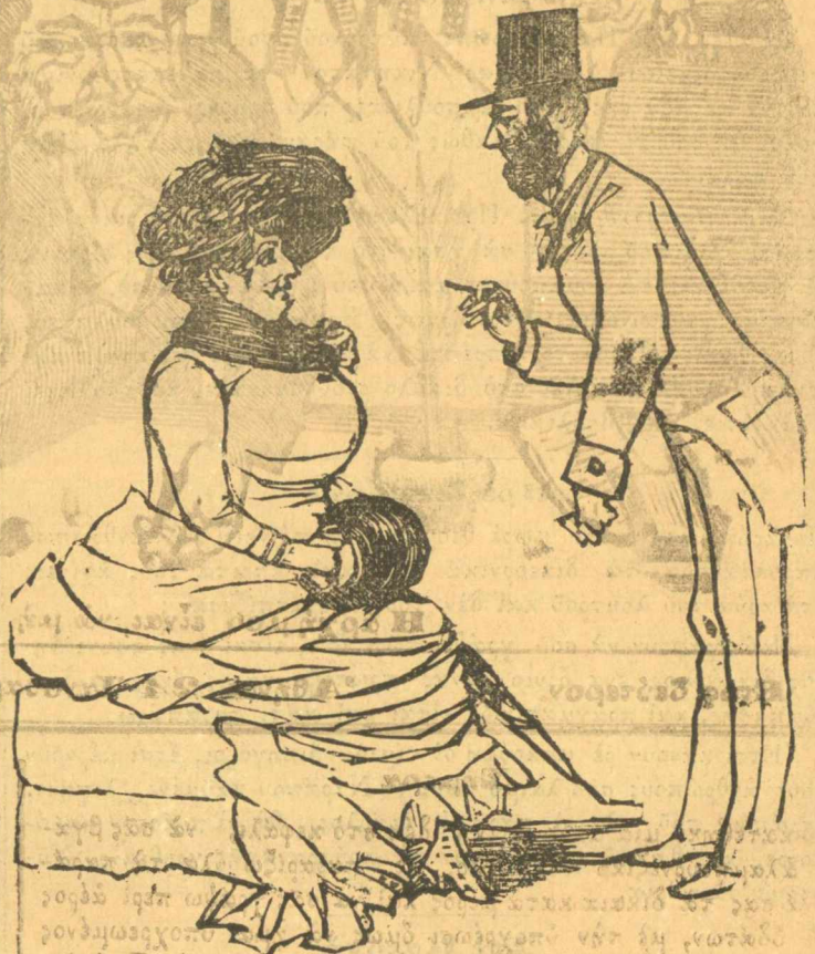
Κυρία παρακαλώ χορεύετε;

Άλήθεια μούπαν πώς και πολύ νέα είσαι και νοστιμού- ταικη. Παύ να το είξερα άρχιτερα να μη σουγραφ τίποτα. Άδριο θα έρθω να σε δω, για να φιλιωθούμε και να φορέσης τα κκαλά σου της τελευταίας μόδας. Αύτά έχει ό κόσμος, για το τίποτα να περνούν τους ανθρώπους σ'ής εφημεριδες. Άς ήναι περαστικά. Γελάς κατεργάρα; Καλό και να δής αν δεν το μαρτυρήσω.