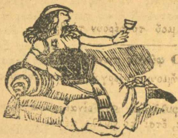
Πώς διασκεδάζουν σ'ής μπυραρίαις.

Κάτω τās χείρας. Και κείνες καταλαβαίνουν πλιό.