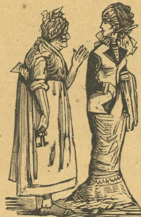
Κυρὰ μου δὲν μοῦ κάρεις γιὰ τὸ σπῆτι μου, γιὰ τὴν μοιάξις σὰ χρυσογαδάρενα.

λους μου, ρὲ ἀδερφέ, αὐτὸ τὸ κορίτσι θὰ μὲ κατακολάσῃ, ἀπὸ ποῦ εἶναι. Αὐτὴ κοντεύει νὰ μὲ φάῃ μὲ τὰ μάτια τῆς. Τότε πλησίασε ἕνας καὶ μοῦ λέει:—Εἶναι Περαιώτισσα καὶ