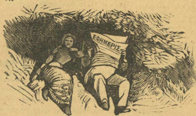
Ἡ προστατευομένη τῆς Νέας Ἐφημερίδας ρεμβάει μὲ τὸν Καμπούρογλο.

γιὰ ροδάκινο, ἔφυγε κ' ὄλο γύριζα νὰ δῶ πίσω μου μπᾶς κ' ἐρχότανε.