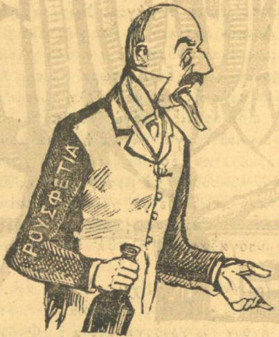
Ἰσχύς ἢ ἀγάπη τοῦ μηχανικοῦ μου.

θέσι, ὅτι δῆποτε γιά νά φωμοζή μόνο τήν οἰκογένειά του. Εἶναι ἄνθρωπος μέ γράμματα, καί ραίζεται κἀνενός ἡ καρδιά νά τόν βλέπη. Ὅποιος εἶναι φιλόανθρωπος καί θέλει νά σώσῃ ἕναν οἰκογενειάρχη, ἄς γυρέψῃ πληροφορίες ἀπό μένα. Βοηθεῖτε ἀλλήλους.