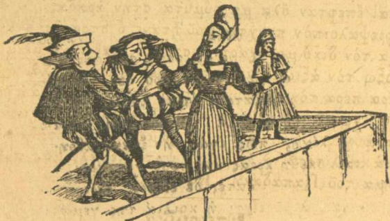
Θὰ πέρω, θὰ πέρω.