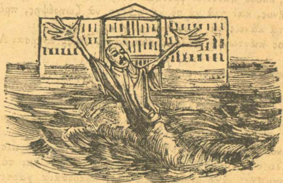
Σῶσον με ἐλέησον ἀπὸ τὴν γουρτοδρα αὐτή.

τὸ ἐμποροραφτάδικο πουλοῦνται ἔτοιμαὶ φορεσαὶς γκερὰν καθὼς καὶ πράγματα πρώτης, αὐτὸς εἶναι καὶ ὁ ράπτης τῆς αὐτοῦ μεγαλειότητός μου, καὶ ὅσοι δὲν τὸ πιστεύετε, κυττάξετέ με αὔριο ποῦ θὰ φορέσω τὰ καινούργια μου. Ὅλοι στοῦ Γύπαρη.