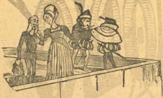
Δεληγιάννης. —Θὰ πέρω μάρα νὰ πιγιῶ στή θάλασσα τῆς ἐπαράστασις.

τύπως αὐτὸς τὸ ἔργο μου χωρὶς τὴν ἀδεία μου, ἂν καὶ ἦναι ἄθλιο, γιατί τὸ γράφα βιαστικά τότε καὶ χωρὶς ὄρεξι. Δὲν μὲ πειράζει τόσο γιὰ τὴν καθαρὴν κακοήθεια τοῦ Φέξη τοῦ κλεψίτυπου τῆς Κωνσταντινούπολις, ὅσο γιὰ τὴν ἀχρειότητά του ποῦ ἔβανε ἀπόξω ψεύτικο ὄνομα καὶ θέλει ἔτσι νὰ μοῦ κλέψῃ καὶ τοὺς κόπους μου καὶ τὸ ὄνομά μου. Νομίζει αὐτὸς ὁ κλεφτο-Φέξης πῶς εἶναι ἡ Πόλι ἐδῶ, καὶ ὅτι μπορεῖ νὰ κερδίξῃ μὲ τὸν ἴδρωτα τοῦ ἄλλου, ὅπως καὶ στὴν Πόλι ποῦ ἔκλεψε τὰ πιεστήρια τοῦ τουρκικοῦ τυπογραφείου, (ἔνα ἀπὸ τὰ ὁποῖα ἐπούλησε στὸν Πάσσαρη καὶ τὸν χαντάκωσε τὸν ἄνθρωπο). Καὶ γι' αὐτὸ μὲν τὸ καθαρὸ κακούργημά του τὸν καταγγεῖλα, γιὰ τὸ ἔργο μου δὲ λέω πῶς εἶναι καθαρὴ ἱστορία, γιὰ τὴν ὁποῖα ἔγεινε λόγος καὶ στὴ βουλή, ἔνεκα τοῦ ὁποῖου λόγου, εὔγαναν ἀπὸ τῆ βουλή καὶ τὸ πρόσωπον ποῦ εἶναι ὁ ἥρωας τῆς ἱστορίας μου, τὸν τότε βουλιαχτὴ τῆς Ἄρτας Νικόλαον . Ἀμβράζην.