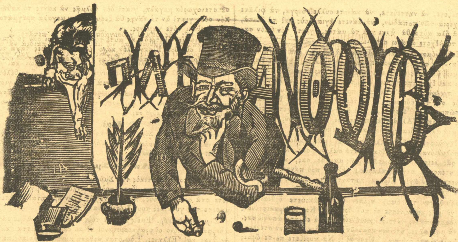
Ἡ ἀρχή μου εἶναι, νὰ μὴν ἔχω κάμμίαν ἀρχήν.