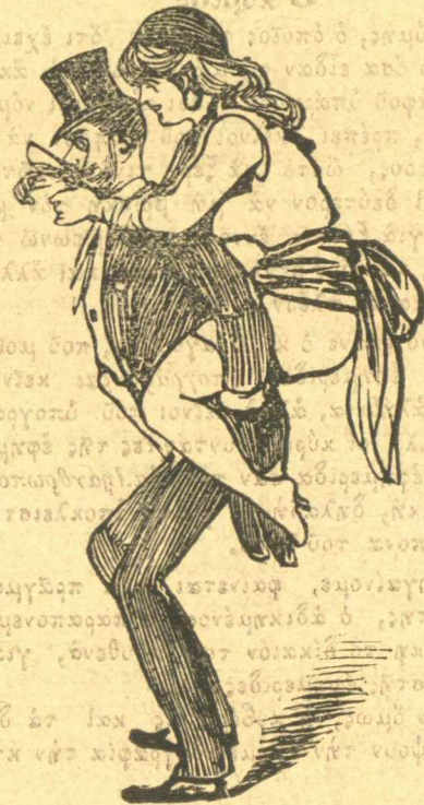
Ἐκθεσὶς ἀνθέων στῆς μπουραρίας.

Ἦστε τί λὲς, δὲν εἶναι δίκαιο ἡ σημερινὴ ζωὴ τῆς Ἑλλάδος νὰ ὀνομαστῇ νέος αἰὼν; Τώρα σὺν ἀνεξάρτητος πού εἶσαι πὲς τὴ γνώμη σου.