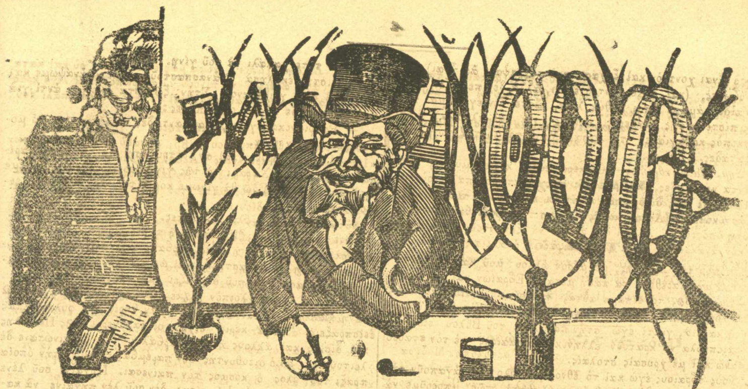
Ἡ ἀρχή μου είναι, νὰ μὴ ἔχω κάμμιαν ἀρχήν.