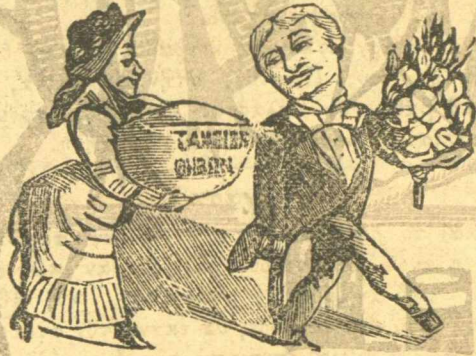
Ἐκθεσὶς ἀνθ' ὄν.

Γιὰ φαντασθῆτε πού ἔφτασε πλέον ἡ αἰσχροκέρδεια, γιὰ νὰ πάρῃ ἕνα φαρμακικὸς πενήντα ἢ ἑξήντα λεπτά, νὰ πέρνῃ ἕνα ἄνθρωπο στὸ λαιμό του. Δὲν φταίει ὅμως κανεὶς, φταίει αὐτὸς ὁ Κοσσοκόκος πού πᾶει καὶ κραιμάται στὰ θεώρετα τοῦ θεάτρου καὶ δὲν ἀνοίγει τὰ μάτια του νὰ ἐφαρμώσῃ τοὺς νόμους καὶ σώζῃ τοὺς ἀνθρώπους.