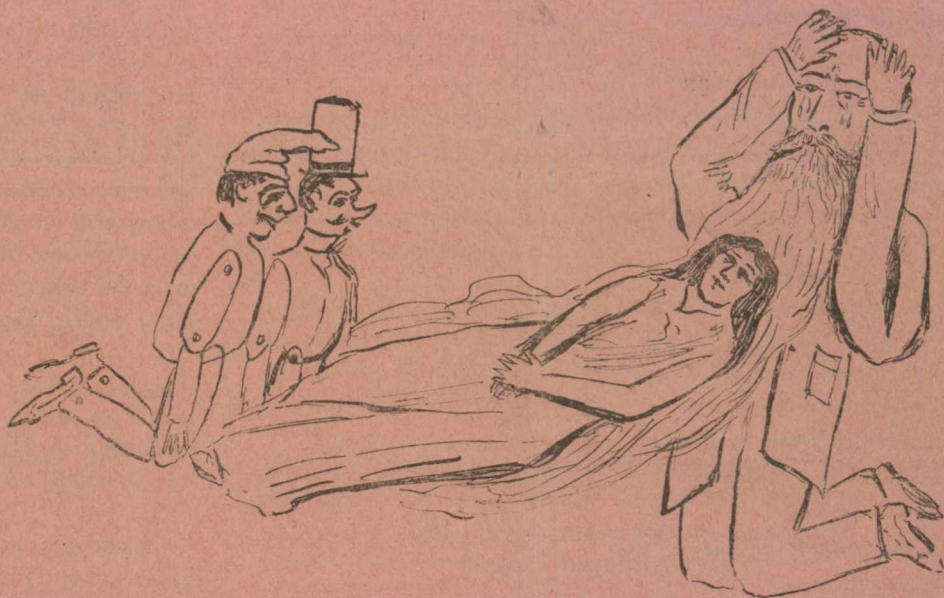
Ὁ Γέρω Μαθουσάλας κι' ἡ ξύλινη δυάδα μαζὶ πικρὰ θρηνοῦνε μπρὸς στὴ φτωχὴ Ἑλλάδα.

Ὅγδόντα τρία ἀριθμὸς μὲ χρόνο τώρα νέο συλλαλητήρια φτωχὰ μὲ λούσιμο γενναῖο.