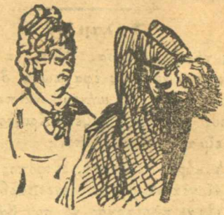
Δάσκαλος — Ὁχου, γυναικί μου, μὲ πάψανε. Γυναικα. — Ἐγὼ σὲ διορίζω.

Σημ. Παληαθρ. Ἐγὼ τοὺς Βαθρακονησῶτες τοὺς πέρνω γιὰ πολὺ καλοὺς ἀνθρώπους και μόνο ὅτι πέρνουν μιὰ δεκάρα τὸν τσίρο και πέντε γιὰ τὰ ψηστικά του, ὅσο γιὰ τῆς στρύγκλης ποῦ μοῦ λές νὰ περάσω νὰ τῆς ὄω, αὐτὴ τὴν ἀνοησία δὲν τὴν κάνω γιὰτί μορεῖ νὰ μὲ πνίξουν.