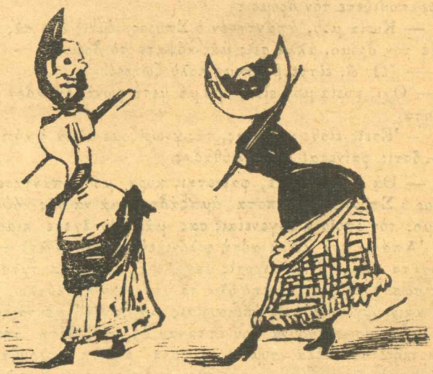
Ἡ νέαις μόδαῖς.

τοῦ κυρ Τρίμη, ποῦ εἶναι ἐκεῖ κοντὰ στοὺς ἁγίους Θεοδώρους και ἀπέναντι τοῦ Γερμανικοῦ φούρνου, ἐκτυποῦνται προσκλητήρια κηδειῶν, και μνημοσύνων εἰς τιμὰς πολὺ συγκαταβατικάς, ἤγουν διὰ 50 ἀντίτυπα δρ. 5, διὰ 75 δρ. 6,50, διὰ 100 δρ. 8.