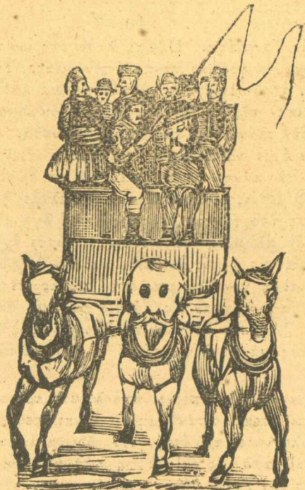
Ἡ ἵπποσδηρόδρομος τοῦ σκετομοῦ τῶν ἀνθρώπων τῶν Ἀμπελοκήπων.

πων μόνο πᾶς νὰ χάσης τὰ μυαλά σου μὲ τὴν μπουραδῶρα Ρόζα; Δὲν ντρέπεσε, ρέ, κοτζάμ γραμματυφλοῦδιον καὶ μάλιστα τοῦ γουρουνδικείου νὰ σὲ ξεμυαλίξῃ μιὰ παληρογυναῖκα; Κύττα τὴν ἐργασία σου νὰ μὴ πάρῃ ὁ διάολος καὶ σὲ καὶ τὴ Ρόζα σου μαζί.