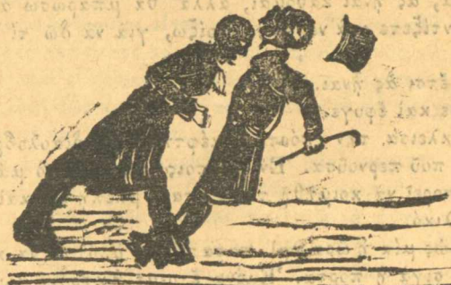
Τὶ μᾶς ἄφησε ἡ βουλὴ γιὰ πρᾶδεύημα. Καὶ τοῦ χρόνου

Κατευόδιον τραμπουκολόγιον, κατευόδιον, καὶ εἶθε ὁ Θεὸς νὰ σὰς στραβώσῃ ὄλους, γιὰ νὰ μὴ βλέπετε σὲ ποῖο βάραθρο πρόχνετε τὴν φτωχὴ πατρίδα. Κατευόδιον μασκαράδες.