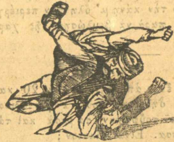
Νομοσχέδιο βουλῆς τὸ πῶς πρέπει νὰ δερνώμαστε.

Σημ. Παληανθρ. Ἰσα ἴσα ἐπειδὴ γνωρίζαμε τὴν τιμιότητα τῶν Κρονηρᾶδων γι' αὐτὸ περιφρονήσαμε καὶ τὸ ἄθλιο ἐκεῖνο γράμμα τῆς ἐπιστολῆς καὶ συμφωνοῦμε ὅτι εἶνε ἀχρεῖστάτοι, φαῦλοι καὶ κακοήθεις κτλ.