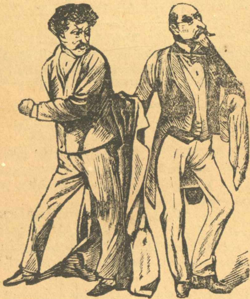
Καλλιγιῶς καὶ Παληάνθρωπος.

Σ. Παλ. Τώρα ποῦ θά συστηθῇ μιὰ ἐπιτροπὴ νά ἐπιθεωρήσῃ τῆς φυλακαῖς, ἴσως λάβῃ πρόνοια καὶ γιὰ σένα νά σ' ἀφήσῃ ἄλλα 6 χρόνια μέσα, γιὰ νά μάθῃς καλλίτερον τί θά 'πῆ δικαιοσύνη τοῦ ἀδίκου.