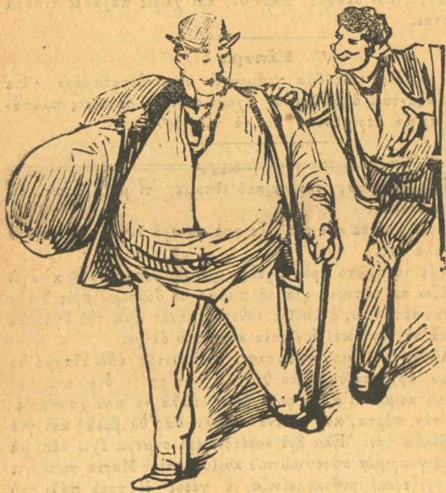
Γκαζοχωρίτης. — Κατευόδιον όμογενή. — Μη μ' άγγέξης. Θερμασμένε.

Σημ. Παλ. Αυτός ό δρόμος θαρρώ πώς είναι του δημοσίου, από το όποιο καλό μη περιμένετε, αν αυτου ή είσοδος της πόλεως είναι τὰ Γόμορα, άς πείε να ήναι, γι' αυτον δέν έχουν 200—500 δραχμαίς να τον φτειάσουν, να ζοδεύουν όμως χιλιάδες να φέρουν χυτές σκάρες και κάγγελα από τὰ Παρίσια για να προφυλάξουν τὰ ευσεβή παλούκια του Σταδίου έχουν. "Αλλο δέν του έπρεπε το καπιδιάρη παρά μαργαριταρένια σκούφια. "Αστε να καταντήση όλος διόλου άδιάβατος και τότε σάς ρίχνουν πάλι λίγα χαλίκια για τὰ μάτια και για τὰ σάς κοροϊδέφουν πάλι και σάς φέρουν και περισσότερη καταστροφή, να πάτε στο διάολο, ή καλλίτερο να πάνε εκείνοι που μάς δικοϋν.