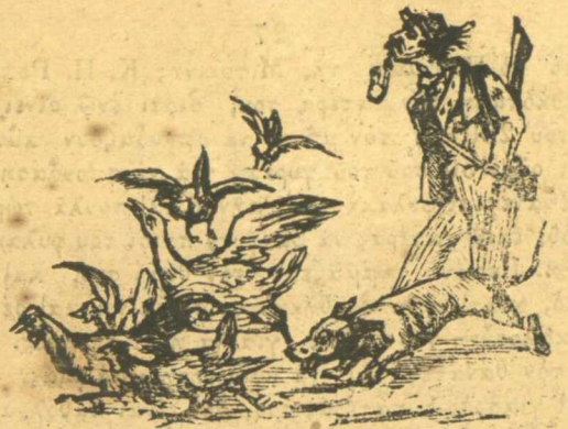
Νά κυνήγι χαμογής μετ' φορά. Άπόρτ.

Διαγράφεται όθεν διαπαντός ή Λίμνη εκ του καταλόγου των καταχωρήσεων, έρ' άπαξ και διά παντός, ως πλαστογραφούσης.