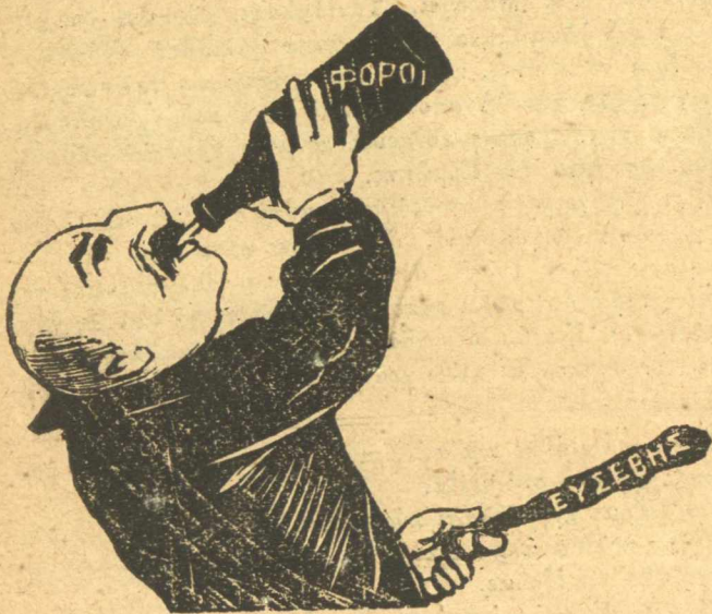
Εἰς ὑγείαν τῆς βλακειᾶς τοῦ ἔθνους.

Ἄλλ' ὁ Ἕλληνας οὐκ τρέφει ἄχυρος ὅπως σὺ. Κόντευι.