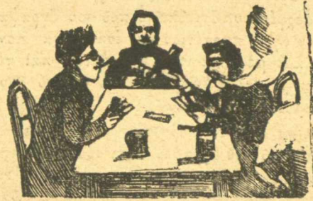
Βλέπουν τὴν τύχη τους μετὸ τραπεζάκι.

ρουδιὰ νὰ πέρνε τῆς κάθες βρωμας ; Πέταξέ τὴν νὰ πᾶ ἐπὶ διάολο, ἐκτὸς πλέον ἂν ἔχη συνάχι.