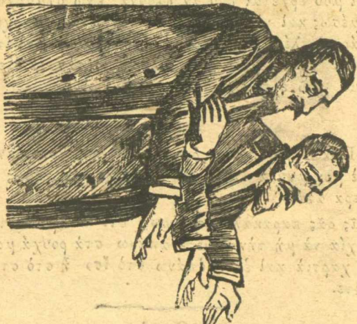
Δουτῶν, οὔτε τώρα δὲν θὰ τὸν ρίξουμε ; Οὐδεμίαν ἄλκις.

Σ' αὐτὴ ἀπάνω τὴν περίσπασι ἔμεῖς βρῖσκουμε μόνο μιὰ σωτηρία καὶ συμβιβασμό. Νὰ μὴ πᾶν νὰ τοὺς ξαναδουλέψουν οἱ ἐργάταις καὶ ἀπὸ τὸ ἄλλο μέρος νὰ ὑποχρεωθοῦν πάλι οἱ χρυσογάδαροι ψωμάδες νὰ τοὺς ψωμίζουν ἐν ὅσῳ δὲν ἐργάζονται, καὶ νὰ δοῦμε τότες τοὺς πέρνομε ἢ δὲν τοὺς πέρνομε νὰ ἐργαστῶν καὶ καταναγκαστικῶς μάλιστα πρὸς νὰ τοὺς τρῶνε τὸ ψῶμι χαράμι.