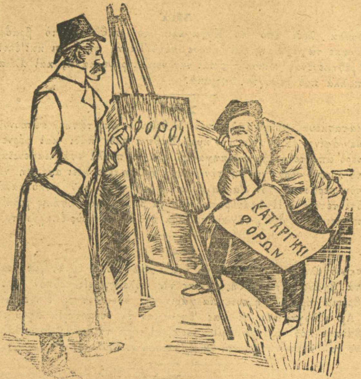
Τὰ προγράμματα των δύο τσαρλατάνων.