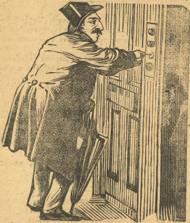
Ο αρχιλοποδύτης του προϋπολογισμού.

Τέλος πάντων πιάνονται τσακόνονται και τους πάν και τους δυο στην αστρονομία όπου χαφόνεται ο φουκαράς ο Κεφαλλωνίτης, έρευνήςδ'ούν γενομένης βρέθηκε άληθινά ότι το έπανωφόρι ήτανε του Κεφαλλωνίτη και το είχε ρίξει στής πλατάις του άλλου άπάνω σε ώρα που τον είχε κλεφτοπάρει ο ύπνος για να μη κρυώσει, σηκονόμενος δέ ο ψηριανός και βρισκόμενος με άπανωφόρι τυ πήρε για δικό του και το κρέμασε στο μπα-