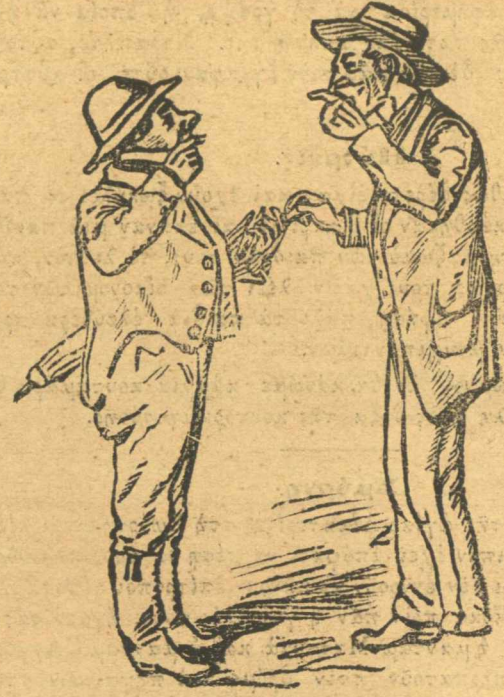
Εἶσαι πληρωμένος ρέ. — Εἶσαι πεινασμένος ρέ.

Διευθύνετε τὰς αἰτήσεις, τὸ ταχύτερον, καὶ συνοδευμένας μετὰ ἀνάλογον ἰσότιμον εἰς τραπεζογραμμάτια παντὸς ἔθνους, εἰς ἔνταλμα ταχυδρομικόν, γραμματόσημα πάσης χώρας, χρηματόδεμα, ἢ ἐπιταγὴν ὄψεως ἐπὶ μιᾷ ἀγορᾷ τῆς Ἑυρώπης, πρὸς τὴν Administration du