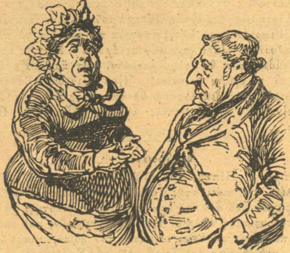
Μιάθε γυναῖκα ὅτι ἂν ᾔσαι μὲ τὸν Τρικούπη θὰ χωρίσωμε. — Εἶμαι, καὶ νὰ χωρίσωμε.