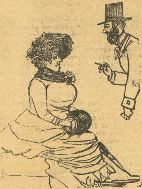
Κυρία χορεύετε ; Κυρία. — Νά ξέρω κ' έγώ;

Λοιπόν κύριοι, να ξέρετε ότι από τόρα και ει; το έξῆς δέν έχει, όποιος χέζει τον Τρικούπη, μέσα, θα ρροῦμε όμως πῶς μπορούμε να τον χέσωμε όλοι και ο άρμόδιος άστυνόος άς επιληφθῆ ανακρίσεων να βρῆ ποιός τάκανε.