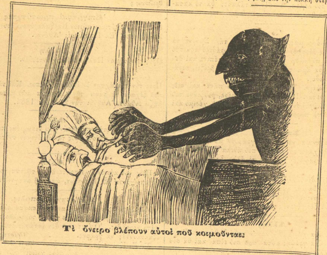
Τὶ ὄνειρο βλέπουν αὐτοὶ ποῦ κοιμοῦνται

διὰ τοὺς καφετζίδες σὲ χρεστὶ χοντρὸ καὶ γερὸ, ἐτυπωθήκανε καὶ που- λοῦνται στὸ τυπογραφεῖο τοῦ Ἀντωνίου Χαλοῦλου. Πάρτε κὺρ καφετζί- δες γιὰτί θά τῆς πάρουν ἄλλοι. Εἶναι περίφημο πρᾶγμα, θά τῆς ἔχετε ἀκόμη καὶ στὴν ἄλλη σας ζωὴ, ἀπὸ τὴν πολλὴ στερεότητά.