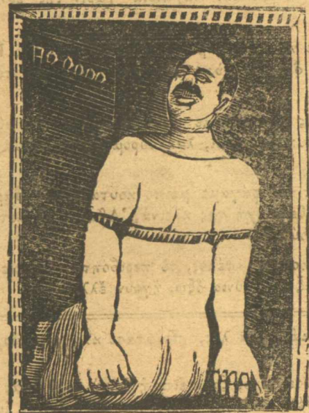
Ὁ Κουταλιανὸς τῶν 170,000,000 μιλ. λουνηῶν εἰς τὴν πόρτα τοῦ Βιδικοῦ.

Ἐπὶ τέλους δὲν εἶμαι καὶ ὑποχρεωμένος κάθε μέρα νὰ σᾶς γράφω ἐξυπνάδες, διότι κεφάλι εἶναι αὐτὸ καὶ φιρένει.