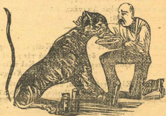
Τὸν ταΐζει ἀπὸ τὰ δάνεια.