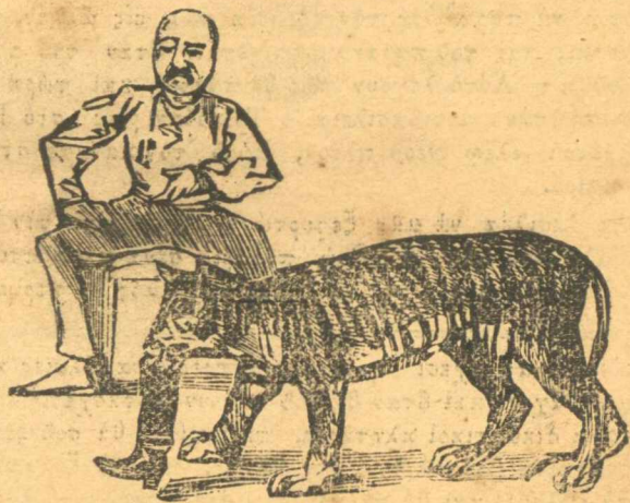
Τὸν μύρεψε, ἀλλὰ φαίνεται πῶς ἀρχίζει ν' ἀγριεύῃ.