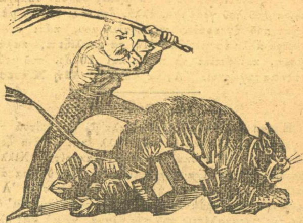
Ὁ ψώφιος Λαός πίνει νὰ σηκωθῆ καὶ τὸν δέρνει ὁ Τρικούπης σας με νέα δάνεια.

οἱ ἀδελφοὶ Κούζιδες ἔχουν τὸ καλλίτερο μαῦρο χαβιάρι. Φαντασθῆτε πλὴν ποῦ ἀνεβαίνουν ἐξεπίτηδες καὶ ἀπὸ τὸν Περαιὰ ἀπάνω γιὰ ν' ἀγοράσουν. Κρυφὰ μούπαν πῶς τοὺς μένει ἀκόμα ἓνα βαρέλι, τὸ ὁποῖο εἶνε θεὸς τῶν θεῶν τῶν χαβιαριῶν.