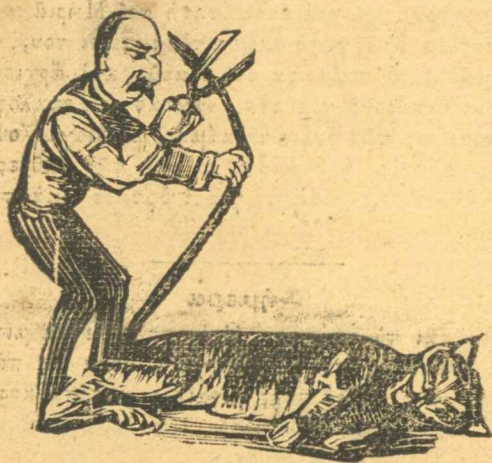
Τὸ φαλλίδισμα τοῦ ψώφιου Λαοῦ.