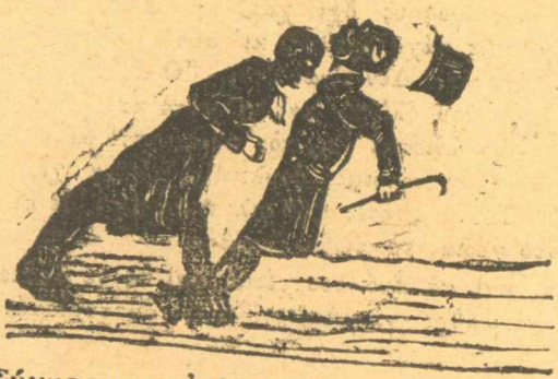
Σύγκρουσις ἀνθρωπίνων ἀσθηροδρόμων.

Μὰ δεν εἶναι μικρὸ πράγμα, κύριοι, ἐκεῖ που περπατᾷς να σὲ τσανώνουν οἱ αμπελοφύλακες και να σοῦ λέν τὸ πουγκί σου ἢ σὲ πάμε πιστάγκωνα μέσα.