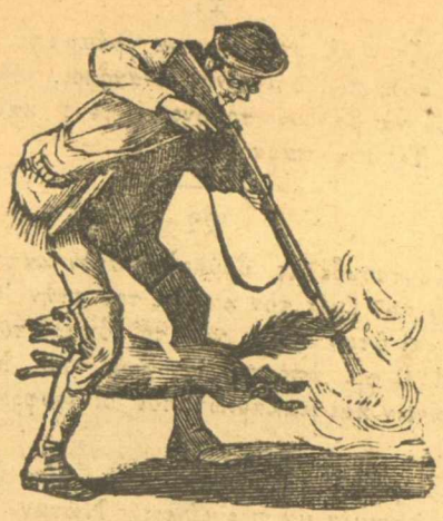
Πρώτης τάξεως κυνηγός που σκοτώνει το σκυλί του.

αυτή την δουλειά είναι αγάριστοι εκείνοι οι φυλακωμένοι που μας τὰ γράφουν αυτά, γιατί ίσα ίσα θέλουν να τους αφήσουν να κάνουν της φυλακας τους ελεύθερη Κέρκυρα και για την ελευθερία αυτή παραπονούνται. Αυτό είναι το εύχαριστώ. Έδω αδερφοί ότι κι αν κάνης δεν μπορείς να εύχαριστήσης κανένα.