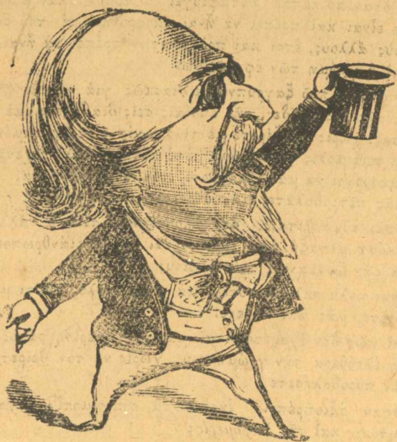
Ζήτω τοῦ Μιστρέλιαου ζήτω.