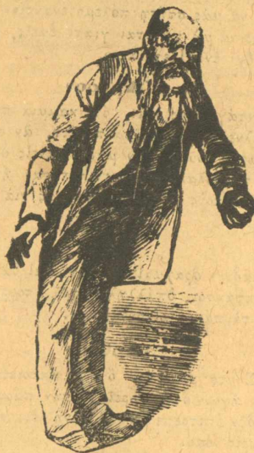
Ἄχ, μούφυγες διαλύσεις καὶ μὲ διαλύσεις καὶ μὲ.

Πρέσβυς, λέει, δὲν λὲς πῶς εἶτε ἕνας χαμάλης, ἔπρεπε νὰ ἦταν ἄλλοι μέσα νὰ τοῦ ἔδειχναν τι θὰ πῆ ἑλληνικὴ μαγκούρα. Γαῖδαρε.