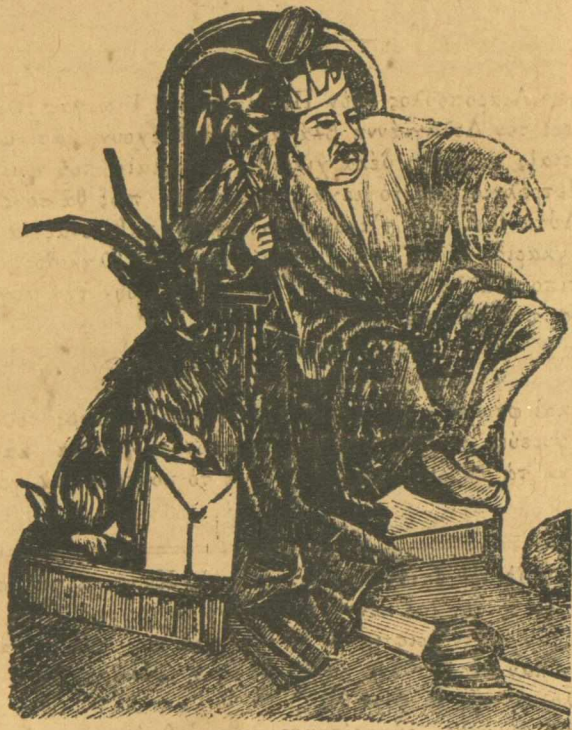
Και τώρα δε με κλονά πλέον κανένας.

Άλλά καθώς καταλαμβαίνω αυτός πού μας έστειλε αυτό τού ζωολογικό μουσειο μετά στην έπιστολή, θα πη πώς θα ήναι κανένας άπό τούς φουρκισμένους, πού θα έστειλε κάμ- μια γράμμα και δεν τήν τυπώσαμε.