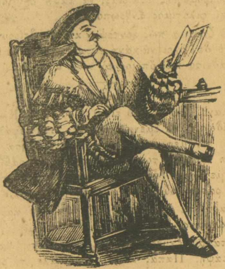
Ο γκράν σενιόρ.

Και κατά τήν άφθάρεια πού έχεις, φαίνεσαι καθαρά πώς είσαι ένας καθαρός άπό τοιοϋτος.