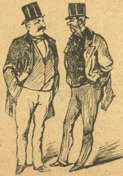
Τώρα θὰ μετρηθοῦμε