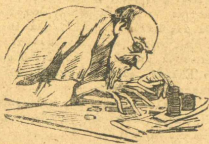
Μετρά τὰ ρουσαφέτια.