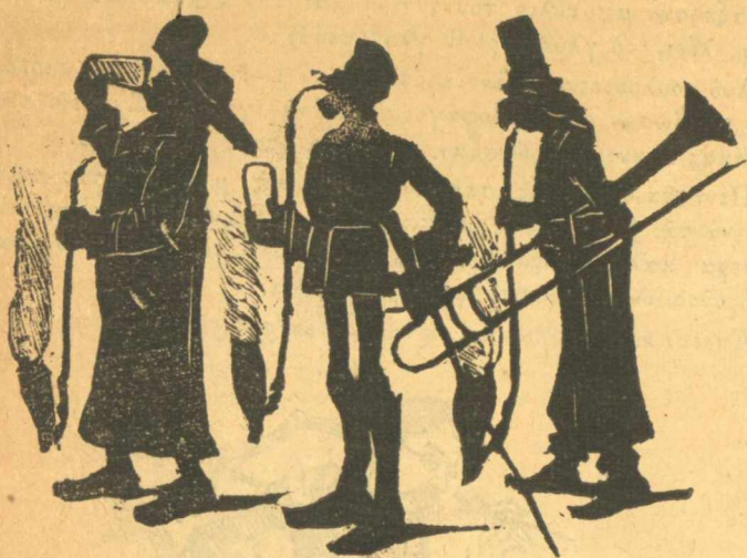
Ο πένθεμος ύμνος του Καλλιγᾶ.

Έτσι μου είπαν οι Μενιδιάτες και έτσι λέω και είμαι άνευθουνοσ πάσης ευθύνης, και ως δώση ευθύνη εις τον βασιλέα του ο κύρ έπιστάτης του.