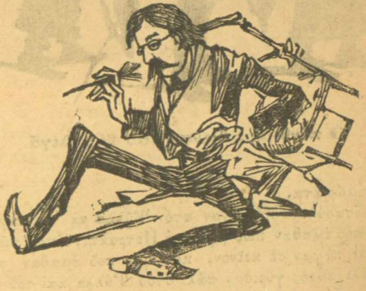
Ο ΤΕΝΕΚΗΣ ΜΟΥ.

"Ἐπειτα καὶ ἀκολουθᾶ σὲ συνέχεια ἐξόδων γοβερῶν καὶ τρομερῶν !