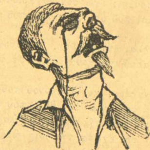
Ο μέγας Καλλιγοῦλας.

Τι θα γίνουν τώρα αυτοί λωποδύτες; Δεν ντρέπεστε, δεν ντρέπεστε.