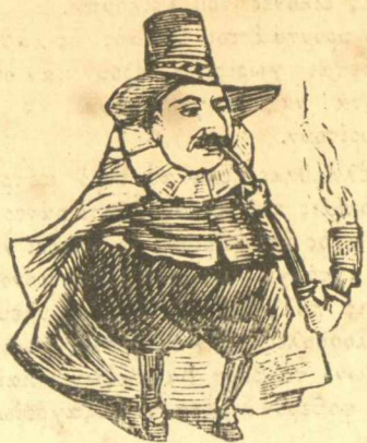
Ο πρώην μ. ν'αργός μας.

"Έτσι κάνουν οι μεγάλοι άνδρες οι λεγόμενοι κουτοφέρνιδες. Υπομονή ως της πάψης.