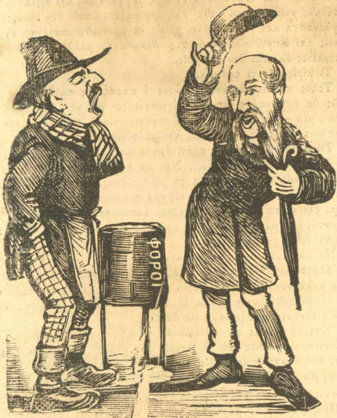
Περίμενε κι' εγώ σε διορθώνω. Τρικούπησ.—Μή χάνεσαι.

Διωνία τους ή μνήμη, και άς μάς κρατούν κρυφά και τα όνόματά τους.