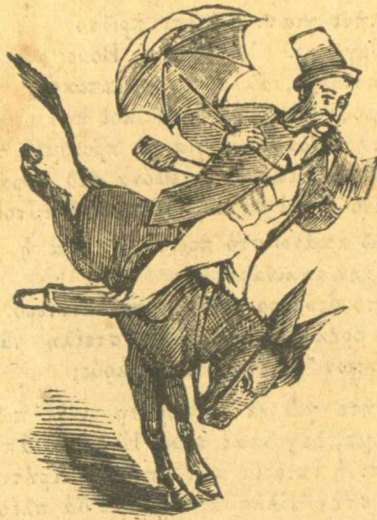
Ρομάντζα στὴ Κηφησοῦα.

Τέλος πάντων τὸ βέβαιον εἶναι πῶς θάχωμε ντράβαλα, ἀν ἡ φίλη Τουρκία, δὲν πάψη, ὡς καθὼς προείπαμε νὰ παίξῃ ἐν οὐ παικτοῖς.