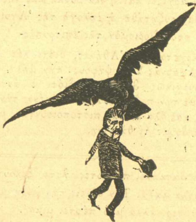
Και υπερυψοῦνται εἰς πάντας τοὺς αἰῶνας.