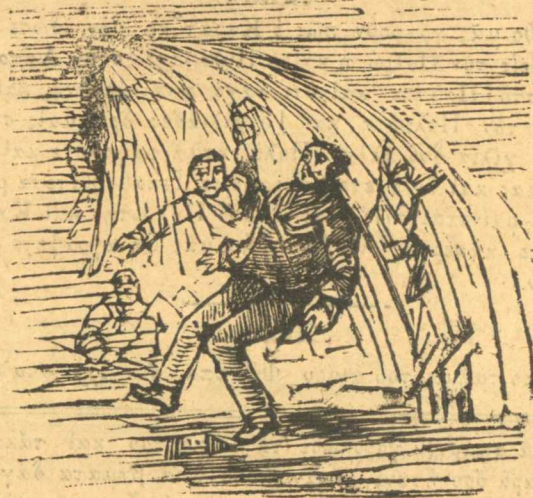
Ἡ προχθεσινὴ βροχὴ.

Θὰ πῆτε ὅτι δὲν ἔχετε πού ἄλλου νὰ διασκεδάσετε. Πῶς; Νὰ γυρίζετε τοὺς δρόμους καὶ σφυρίζετε. Μπούφοι, ἔτσι κάνομε καὶ μεῖς ἐδῶ ὅσοι δὲν ἔχομε λεπτὰ νὰ πᾶμε στὰ θέατρα.