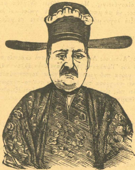
Ὁ ἀρχιμαδαρίνος τῆς ἀντιπολίτεψης

Τόση τρέλα πάλι δὲν τὴν πιστεύαμε, ἀλλὰ ἀφοῦ ἔγινε μιὰ καλὴ ἀρχὴ εὐχόμεστε δλοι οἱ ἐρωτευμένοι να πᾶν δπως και ο φοιτητὴς για να σωθοῦμε ἀπὸ τῆς νυχτερινῆς των πατηνάδες και γαῖδουροφωνᾶρες καυγάδες και λοιπά. Γένοιτο.