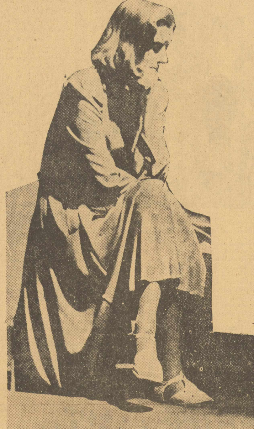
Η Γκρέτα Γκάρμπο που πρωταγωνιστεί μαζί με τον Μελβίν Ντούγκλας στη «Νινότσκα»