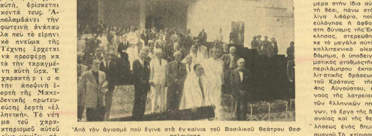
Από τον άνοισμό που έγινε στα έγκαίνια του Βασιλικού Θεάτρου Θεσσαλονίκης.