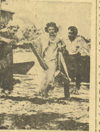
ΚΑΤΑΚΛΥΣΜΟΣ: Ἀκουσθήκανε οἱ τροσεκοὶ τῶν Ἰνδῶν...