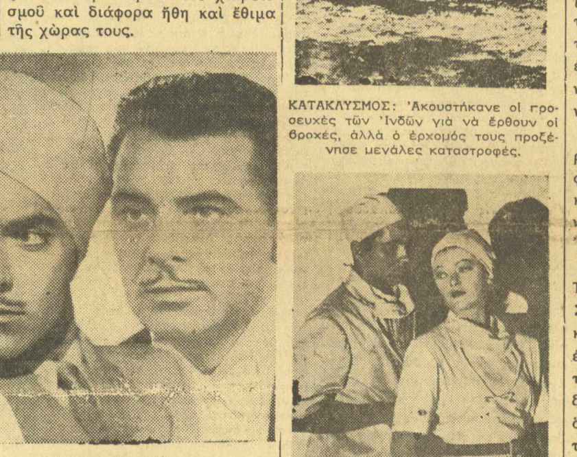
Ὡ Μύρνα Λούου στὸν ρόλο τῆς λαίδης Ἑσκὲθ...