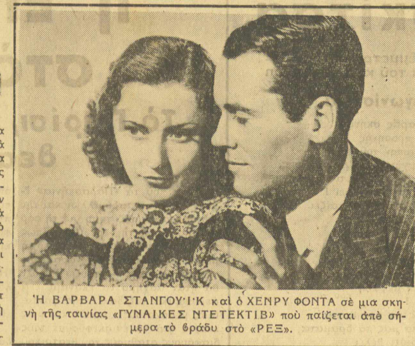
Η ΒΑΡΒΑΡΑ ΣΤΑΝΓΟΥΪΚ και ο ΧΕΝΡΥ ΦΟΝΤΑ σε μια σκηνή της ταινίας «ΓΥΝΑΙΚΕΣ ΝΤΕΤΕΚΤΙΒ» που παίζεται από σήμερα στο θέατρο «ΡΕΞ».