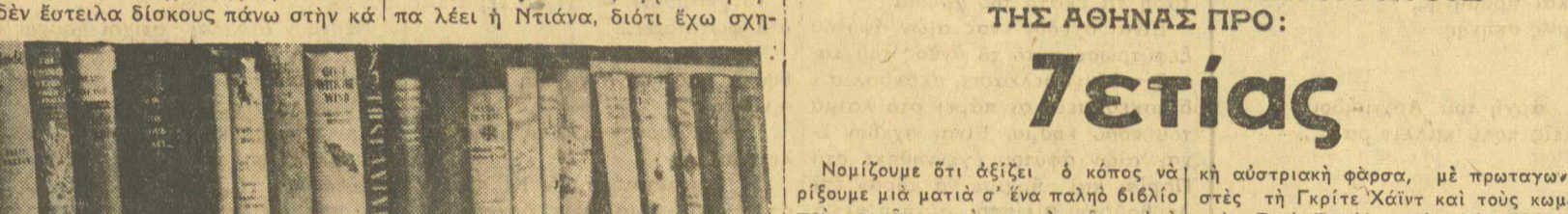
Το θείο που προτιμάει η Ντιάνα Νταρμπίν