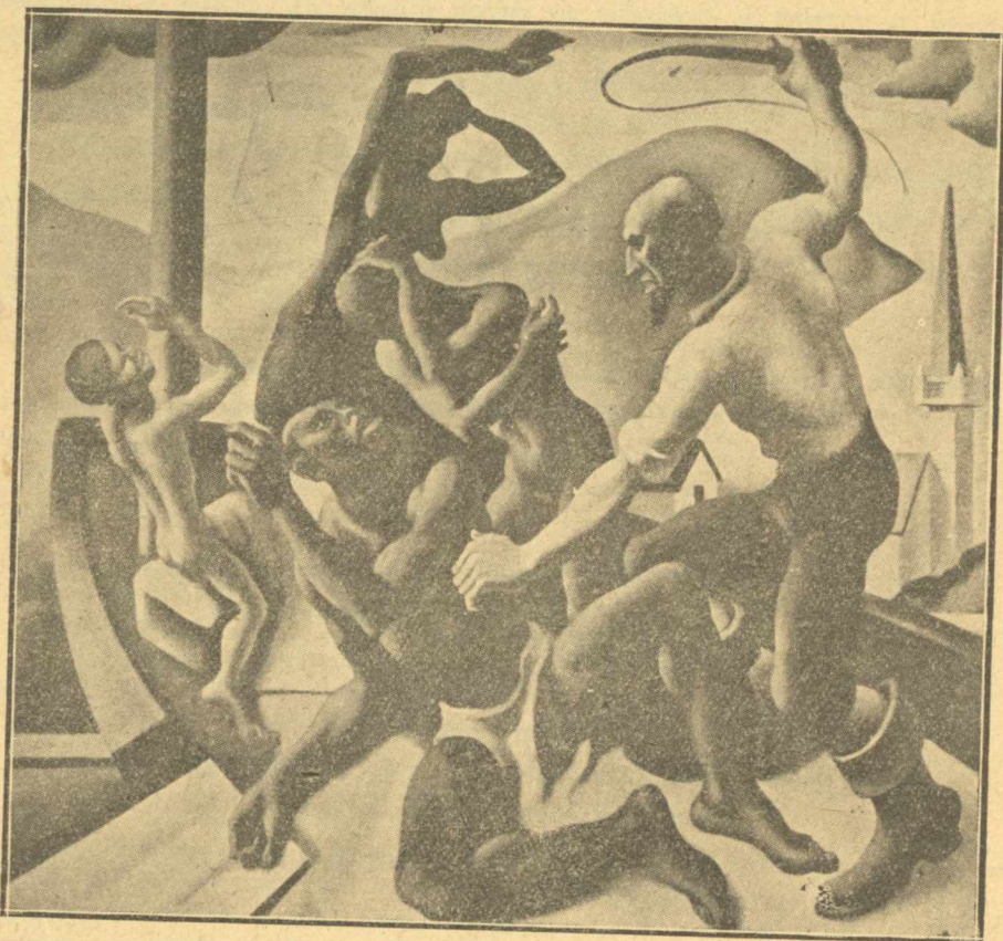
THOMAS H. BENTON : ΟΙ ΣΚΛΑΒΟΙ