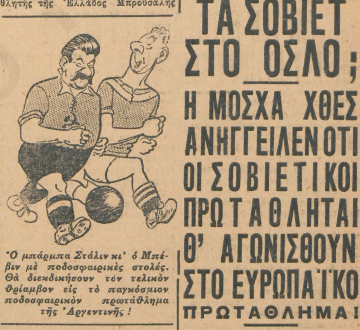
Ο μπάρμπα Στάλιν κα' ο Μπέβιν με ποδοσφαιρικές σφαίρες. Θα διεκδικήσουν τόν τελικόν θρίαμβον εις τή παγκόσμιον ποδοσφαιρικόν πρωταθλημα τής 'Αγγουίνης!

Εθνικός 4 α' νίκας, ο Όλυμπιακός 3 και τή Παλ. Φάληρον 2 Επί διεξαχθέντων ενέντα αγωνισμάτων κατά τούς χθεσινούς κολυμβητικούς αγώνες, ο Εθνικός έπέτυχε τέσσαρες πρώτες νίκας, ο Όλυμπιακός τρεις και τή Παλαιών Φάληρον, τή όποιον δίδν μετ'εγχε με πλίρες ο ομάδα δύο. Οι άγώνες παρουσίασαν ένδιαφέρον λόγω τού άνακαταχθέντος συναγωνισμού. Τά μεγαλύτερον ένδιαφέρον παρουσίασε ο άγών των 600 μέτρων άνδρών, εις τόν όποτον ο πρωταθλητής τής 'Ελλάδος Μπρούσαλης κατόπιν παλαιωτούς αγώνος ένίκησε τόν 'Αμερικανό Ντιούκ, ο όποιος μετ'εγχε εις τούς άγώνες έκτύχως συναγωνισμό, και τόν πρωταθλητή τού Όλυμπιακού Χάλα. Ο Μπρούσαλης προηγήθη κατά 16 μέτρα τού 'Αμερικανού μέχρι των 500 μέτρων, ότε ο 'Αμερικανός άνάπτυξε έπικινδύνως τόν Φα... [συνέχεια εις τήν 2αν σελίδα]