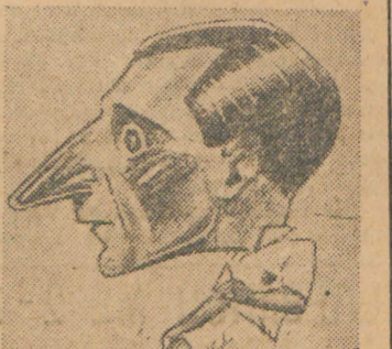
Ο θρυλικός Σουηδός άσος Χιννεμπεργκ που ώδήγησε τήν Σουηδικήν έπίθεσιν εις τόν τελευταίον της θρίαμβον κατά τής 'Ελβετίας με 7-2

Ο ΕΦΕΥΡΕΤΗΣ ΤΗΣ ΑΤΟΜΙΚ. ΒΟΜΒΑΣ ΝΙΛΣ ΜΠΟΡΣ ΔΙΕΘΝΗΣ ΠΑΙΚΤΗΣ ΤΗΣ ΕΘΝΙΚΗΣ ΔΑΝΙΑΣ Εϊς τήν έγκλησιν άθλητικόν παρουσιάζουν 'Ρεκόρ' δημοσιεύεται με έκτετακώς ένδιαφέροντα έδησεις. Ο πασίγνωστος άνδριότχης νικητής έφύρτησε τή διασπίσασ του άσμου, ο όποιος και κατά τόν 1936 έλάβε, τή βραβεύση Νόμπελ εις τήν φυσικήν, ήτο εκ των καλύτερων ποδοσφαιριστών τής 'Εθνικής Δανίας όμάδος. Όταν ο Γερμανός εισηγήθη τόν 1941 εις τήν Δανίαν, ο Νίλς Μπόρς ένα πλοκάριο κατέφυγε στην Σουηδία, άπ' όπου 'Αμερικανικοί άεροπλάνοι τόν μετάρησαν στην Νέα Υόρκη. Έκει ο Νίλς Μπόρς έπί κεφαλής των 'Αμερικανών έπιστημόνων έτελειοποίησε τήν βόμβα τού άτόμου που έφύρθη εις τήν Χιροσιμα και που έόχησε τόν τέλος τού κόσμου.