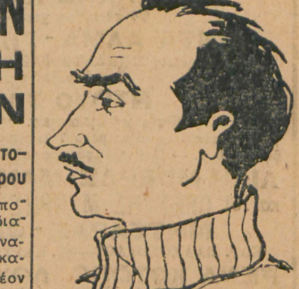
Ο 'Ελλην Βαλκανικός Καταγιάσος τού μεγάλου κλάς τής ποδάρων τών 800 κατά τούς αγώνες τών Δαλλείων

ξαρτήτως των τελευταίων άποτελεσμάτων, που όσημείωσε διακρίθει σήμερα άγέρωχη, δυναμική και άπτητρον ομάδα Ικαυήν να σημειώση και τάς πλέον άπιδάτους νίκας. Διόν να σημειώθη ότι τή Πειραιώτικόν σωματείου θα έπιδιώξη μίαν άναμφισβήτητρον νίκην δικαιογούσαν τού πρό 15ήμερον θριαμβευτικόν τού σκορ επί τής Μικτής (Συνέχεια εις τήν 2α σελίδα)